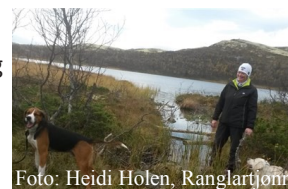
Ranglartjønn